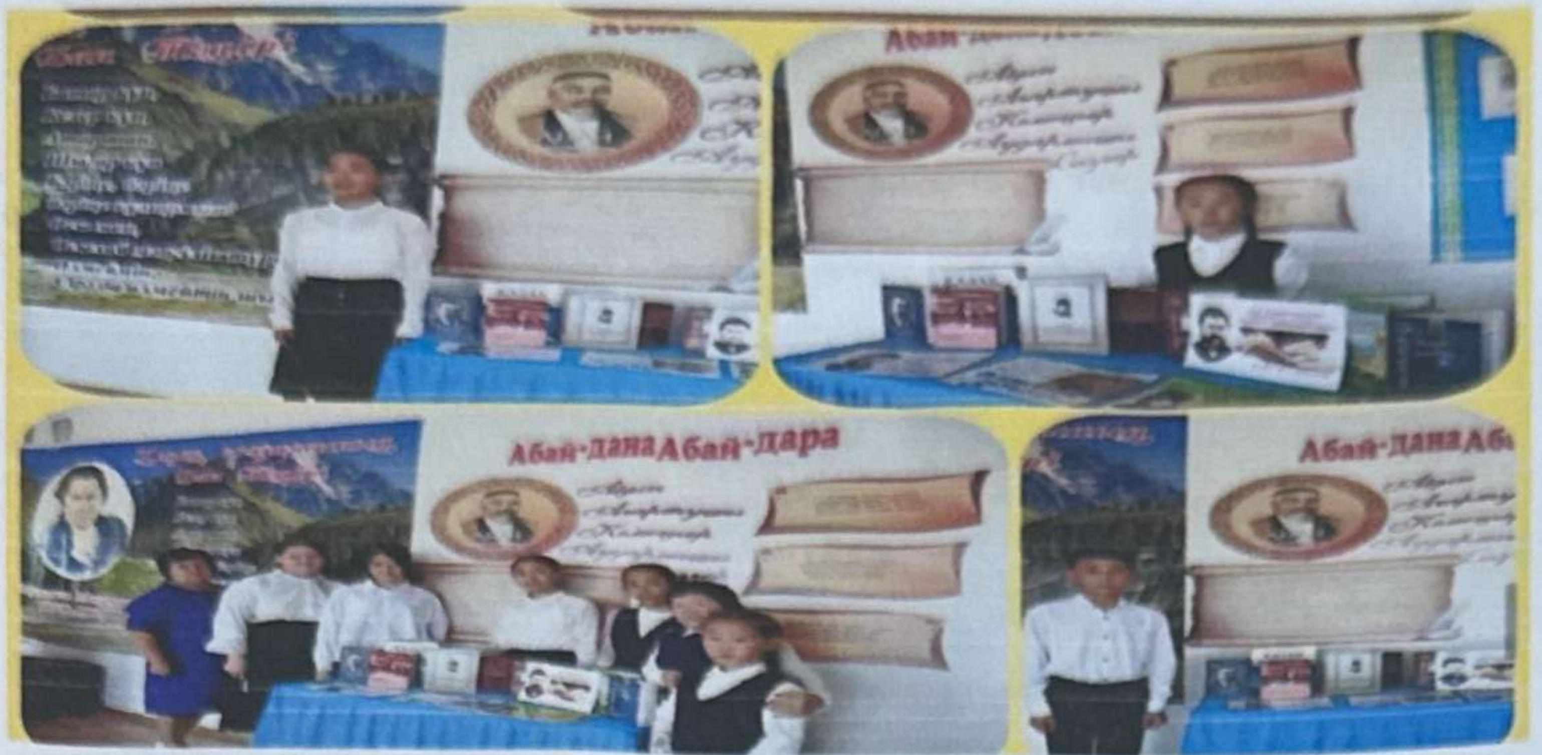
Республика күніне орай мектебіміздің кітапханасында «Менің Отаным Қазақстан» тақырыбында кітап көрмесі ұйымдастырылды.